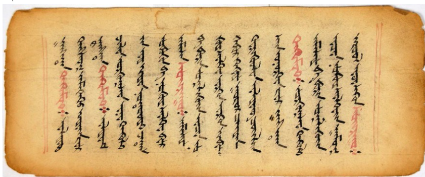
Цагаан өвгөний сан тахилга оршвой. Газар усны сан оршвой хэмээх тод үсгийн судрын хэсэг

Тухайлбал: Дундговь аймагт орших Их Газарын чулуу хэмээх байгалийн үзэсгэлэнт уулын тахилгын сударт: “... хар хүрэн өнгөт лагшинтай, нэг нигуур, хоёр мутартай., баруун мутартаа балт сүх, зүүн мутартаа төмөр гох барьсан, айдас хүргэм, хүрэн тэмээ хөлөглөсөн ” [Sa chen ri po'i bsangs mchod 'bul tshul mdor bsdus pa las bzhi lhun 'grub bzhugs so, 3 х.] гэж байхад Завхан, Говь-Алтай аймгийн зааг нутагт орших Хасагт хайрхан уулын сангийн сударт: “... хөхөмдөг сарлагийн дээдийг хөлөглөсөн ” [Ha sag thu ha ri han la bsangs mchod bkra shis sman ljong zhes bya ba bzhugs s., 4 х.] хэмээсэн байх жишээтэй. Харин Ойрад ястнуудын хувьд газар орон, мал сүргийн эзэн сахиус бол Цагаан өвгөн байх ажээ.