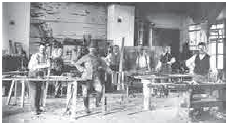
Столярная мастерская военнопленных. Ст. Заиркутный городок. 1916.