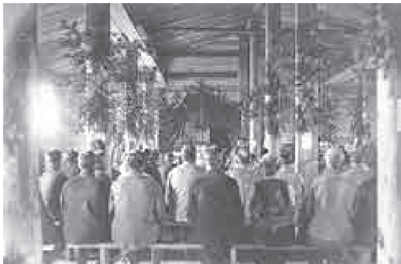
Иннокентьевский концентрационный лагерь для военнопленных. Иркутск. 1916. ИОКМ

Следует отметить, что большинство просьб удовлетворялось. Так, 24 ноября 1916 г. была отслужена панихида и установлен траур по императору Францу-Иосифу, 27 ноября 1916 г. – богослужение в честь восшествия на престол императора Карла, 14 января 1917 г. было разрешено богослужение и исполнение императорского гимна в честь дня рождения немецкого императора Вильгельма. В рождество 25 декабря 1916 г. было разрешено провести рождественскую елку для нижних чинов до 1 часу ночи за счет средств офицеров. Особенно активизировалась деятельность Динера после появления в лагере католического священника Дрекслея, который был переведен с Дальнего Востока, где «содержался долгое время под арестом по подозрению в шпионаже» 1 .