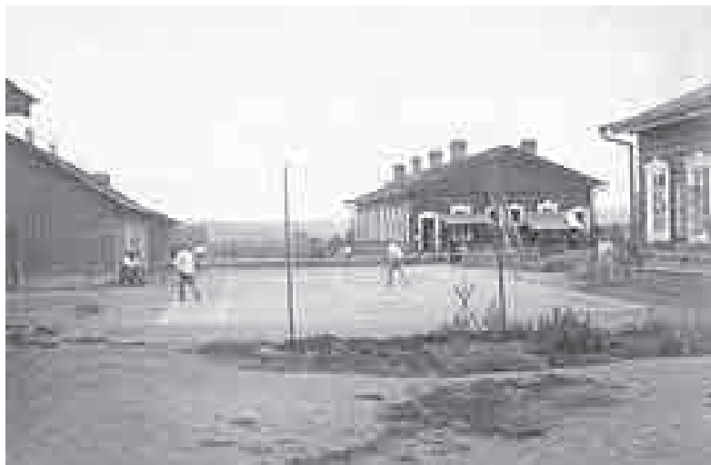
Пленные офицеры играют в лаун-теннис. Ст. Заиркутный городок. 1916.