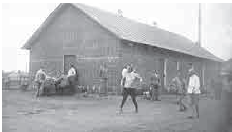
Игра в карты австро-венгерских офицеров. Ст. Заиркутный городок. 1916. ИОКМ

каменные казармы двух стрелковых полков; Нижняя Березовка (под Верхнеудинском) – капитальные казармы для стрелковой бригады; Иркутск (а точнее Заиркутный военный городок) – деревянные бараки, построенные спешно в 1904–1905 гг., однако полностью отремонтированные перед войной, и одно каменное здание, где был развернут госпиталь для военнопленных; Нижнеудинск – бывшие казармы 8 Восточно-Сибирского горного дивизиона (построены в 1908 г.); Красноярск – военный городок стрелковой бригады; Ачинск – каменные казармы 29 Сибирского стрелкового полка (построены в 1908 г.); Канск – казармы стрелкового полка. Из первых лагерей выпадает только Нерчинск, но и там имелись казармы, принадлежащие ЗКВ.